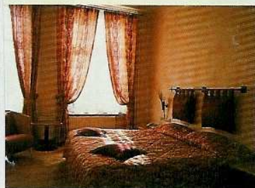
Botticelli: ruime sfeervolle kamers.

trompe l'oeils, grisailles en rijkelijk beeldhouwde ornamenten. De kamers zijn ruim en hoog en hebben elk een eigen kleurschema en sfeer. Alle kamers zijn voorzien van een luxueuze badkamer. Wie hier gaat logeren, mag vooral het gastenboek niet vergeten: alle gasten roemen niet alleen de sfeer en de kamers, maar ook het fantastische ontbijtbuffet,